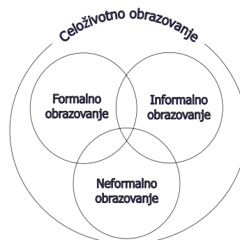
Slika 1. Međusobni odnos formalnog, informalnog i neformalnog obrazovanja

Ipak, kako prikazuje slika 1, zone ova tri „sektora“ u obrazovnom prostoru svakoga od nas nisu tako oštro odvojene, tako da postoje brojni slučajevi različitih obrazovnih aktivnosti koje imaju karakteristike dva ili čak sva tri sektora istovremeno. Prisetite se samo koliko ste informalnog obrazovanja (sasvim neplanirano) stekli na školskim odmorima ili u pauzama za kafu tokom treninga. Ili razmislite da li biste recimo kurs jezika izveden van formalnog sistema, ali sa svim karakteristikama stare tradicionalne škole, nazvali neformalnim obrazovanjem? Ili, da li je trening za nastavnike, akreditovan od strane Ministarstva prosvete, a izveden od strane organizacije koja nije u sistemu formalnog obrazovanja, u prostorijama neke škole, formalno ili neformalno obrazovanje?